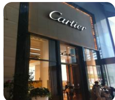
カルティエ新作発表 パーソナルカラーコンサルティ