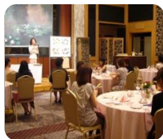
三菱重工業株式会社 「パーソナルカラーセミナー」

人がもつ「魅力」とは、身だしなみ（女性の場合はメイクアップも含む）などの外見的な要素と、その人がもつ考え方や感性など内面的な要素が融合され作り上げられています。今回提案させて頂くセミナーは、「パーソナルカラー診断により生き生きと輝いて見えるお似合いの色」をご提案させて頂き、更に「DISC行動心理学により言葉や行動を分析し、タイプ別の行動心理を謎解く」ことにより、外面と内面からのトータル的なアドバイスをさせて頂くものです。