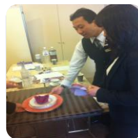
ANA クラウンプラザホテル ホテルグランコート名古屋 社員研修 テーブルコーディネート